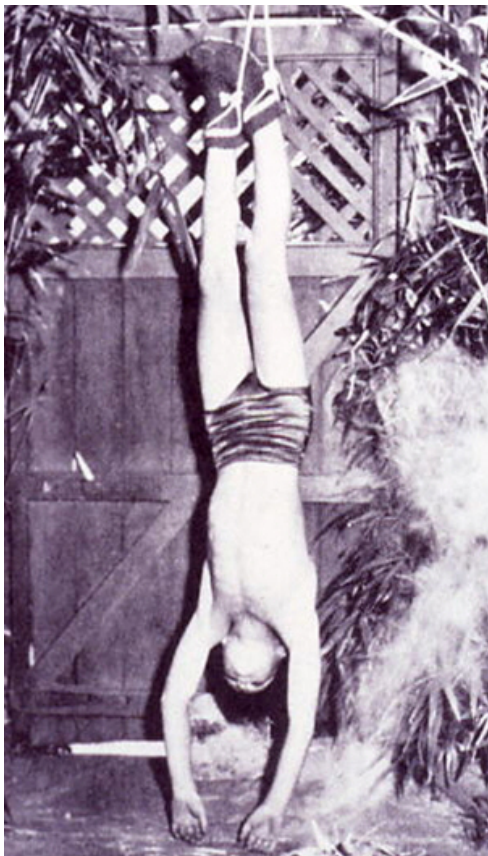
Figura 1.1 Técnica de Inversión Inglaterra 1768

Otro de los métodos que precedieron a la Reanimación Cardiopulmonar, consistían en realizar una estimulación física y táctil en un intento por “despertar” a la víctima. Gritos, golpes en las mejillas, azotes, se utilizaron para tratar de resucitar a cada paciente que caía en un PCR. Entre estos métodos arcaicos también se pueden encontrar la flagelación, la calefacción externa, rodando sobre un barril, o colocar al paciente en la espalda de un caballo haciendo correr a este por todo el campo, llevando a trote al paciente.