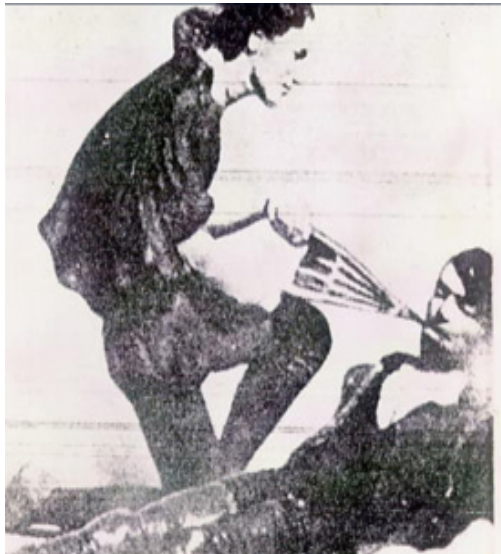
Figura 1.2 Técnica de Ventilación con Fuelle.

La observación de los estudiosos, los llevó a la conclusión de que debían mantener el cuerpo caliente, con un calor constante y ventilado continuamente, para ello, también existen registros del uso de fuelles (Aparato utilizado para expulsar aire en una chimenea para así avivar el fuego) colocados en la boca, método que se utilizó durante casi 300 años y que se registró en los años 1493-1541 aproximadamente (Ver figura 1.2). Esta técnica de ventilación con fuelles, es el primer acto de manejo de la vía aérea utilizando un accesorio modificado para esta técnica.