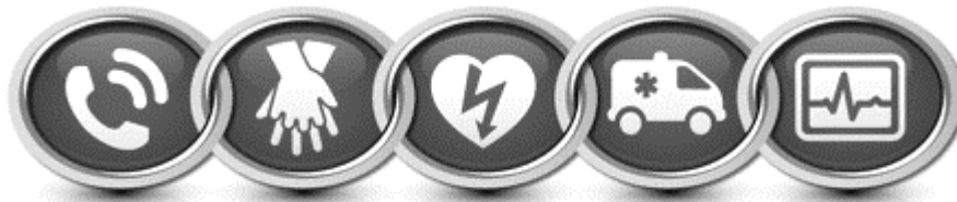
Imagen 1.6 Cadena de Sobrevivencia

Empezar por las compresiones torácicas puede animar a otros testigos a iniciar la RCP. El soporte vital básico suele describirse como una secuencia de acciones, definición que sigue siendo válida si el auxilio lo presta una sola persona, dichas acciones se encuentran definidas en la cadena de sobrevivencia de la ACE de la AHA para pacientes adultos (Ver imagen 1.6).