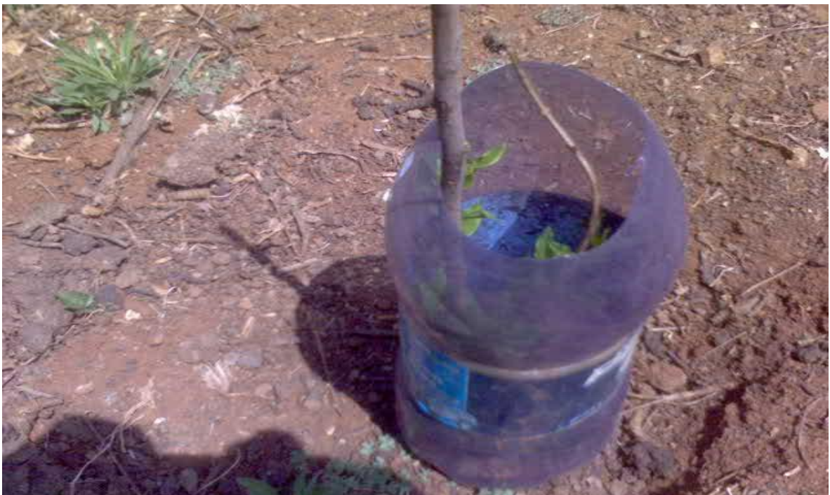
Figura 10. Protección de árboles frutales recién plantados entre cultivos permanentes en la comunidad de Tesahuapa, Municipio de Atotonilco el Grande, Hgo.