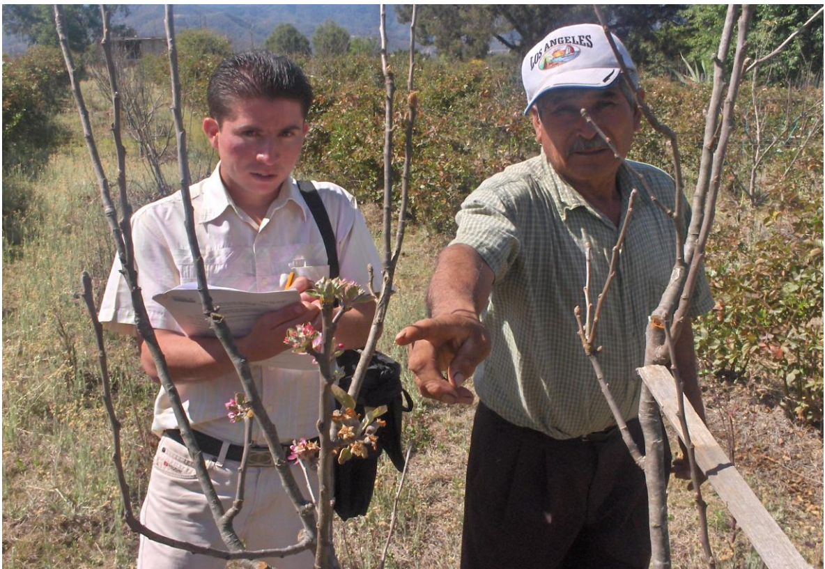
Figura 12. Poda de fructificación en árboles de manzana ( Malus domestica ) intercalados en cultivos permanentes en la comunidad de Tesahuapa, Municipio de Atotonilco el Grande, Hgo.