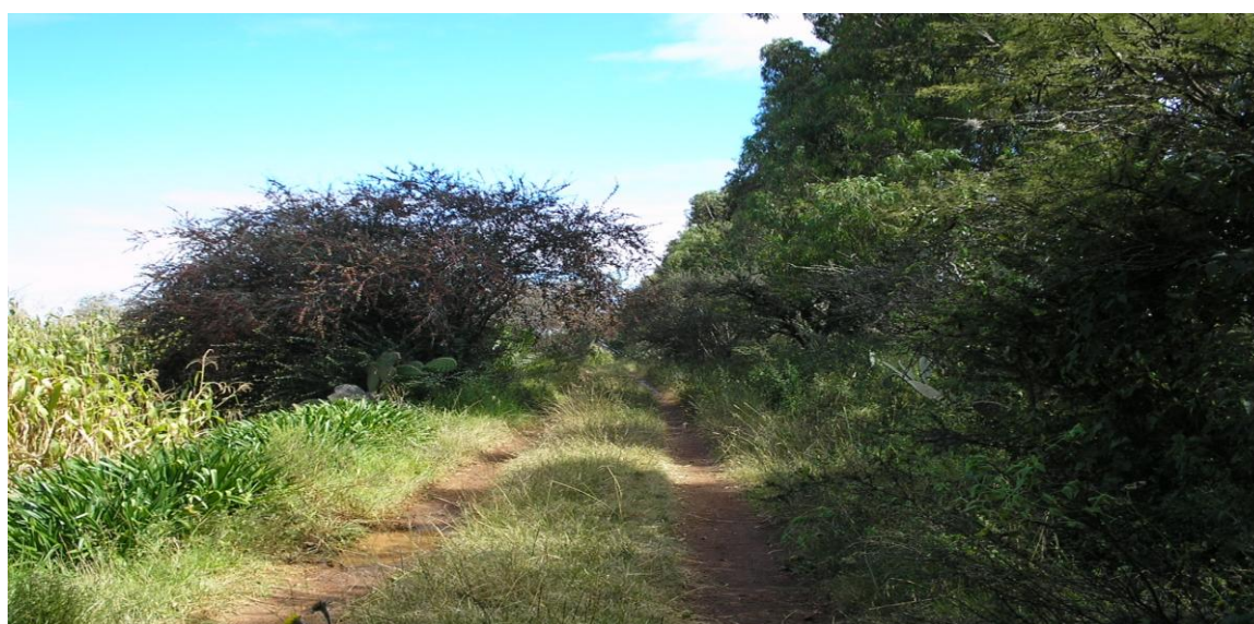
Figura 17. Cortina rompevientos protegiendo un cultivo de maíz en la comunidad Los Sabinos, Municipio de Atotonilco el Grande, Hgo.

Fisonómicamente las cortinas rompevientos se presentan de diversas formas, algunas constituidas por una sola especie y un solo estrato, formados con árboles ocote ( Pinus greggii ) y el cedro blanco ( Cupressus lusitanica ), en el 90% de los casos se encontraron combinaciones de las especies antes mencionadas formando tres estratos: bajo (de 0 a 8m), medio (va de 8 a 16m) y alto (de 16m en adelante).