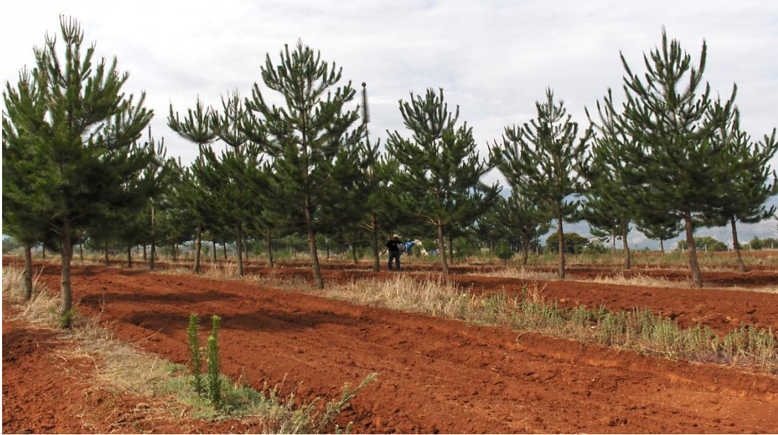
Figura 14. Preparación del terreno para la siembra de cultivos anuales intercalados con ocote ( Pinus greggii ) en la comunidad de San Miguel, Municipio de Atotonilco el Grande, Hgo.