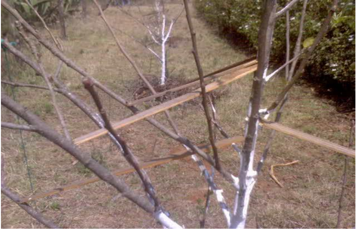
Figura 11. Técnica de apertura de ramas en árboles de manzana ( Malus domestica ), intercalados en cultivos permanentes en la comunidad de Tesahuapa, Municipio de Atotonilco el Grande, Hgo.