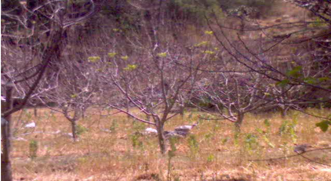
Figura 13. Manzanos intercalados con cultivos anuales (avena y haba) en la comunidad de Tesahuapa, Municipio de Atotonilco el Grande, Hgo.