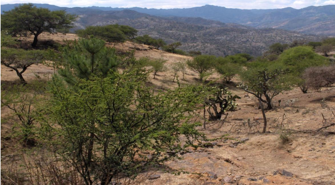
Figura 18. Árboles de huizache ( Acacia farnesiana ) dispersos en praderas en la comunidad de Tesahuapa, Municipio de Atotonilco el Grande, Hgo.