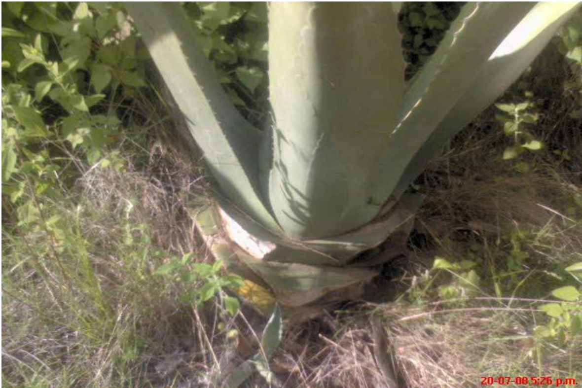
Figura 15. Poda del maguey ( Agave salmiana ).