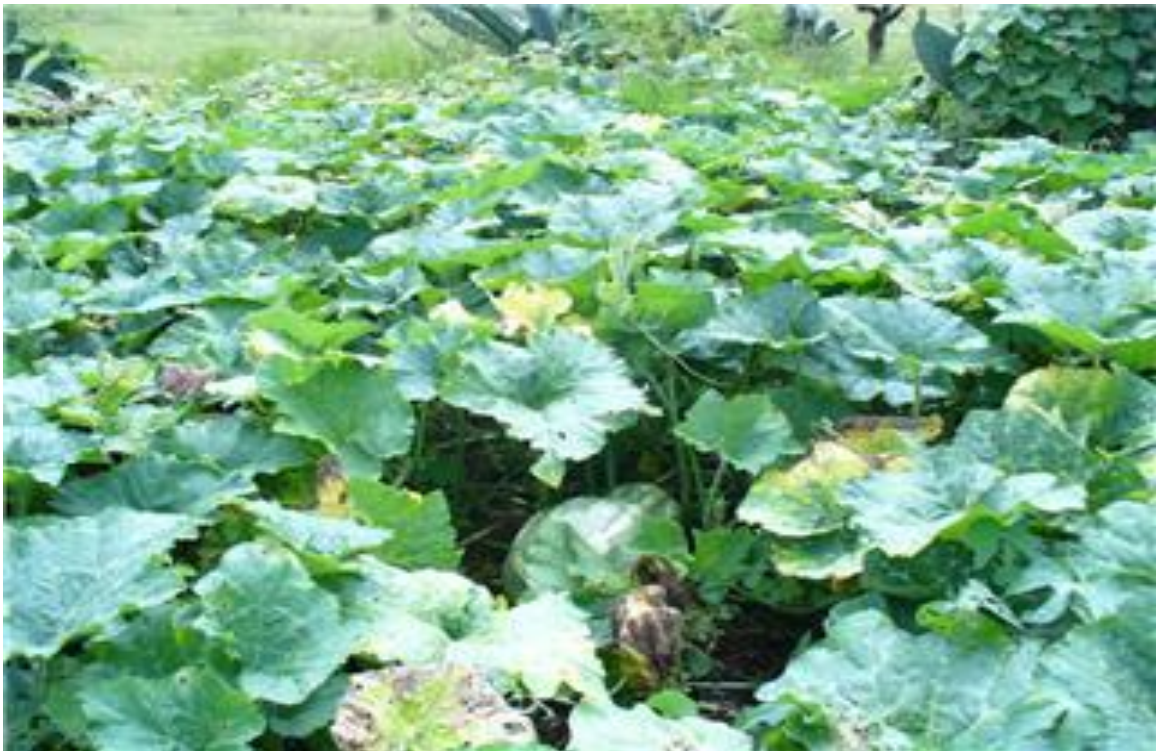
Figura 20. Producción de calabaza utilizando los residuos de la nuez como materia orgánica, en la comunidad El Contadero, Municipio de Atotonilco el Grande, Hgo.

Las podas se realizan manualmente con hacha y machete utilizando las ramas cortadas para leña y postes. Los frutos del nogal ( Juglans pyriformis ) se cosechan manualmente trepando al árbol, o bien se sacuden las ramas para luego ser recogidos del suelo, los frutos se encostalan y se llevan a la vivienda para ser limpiados con una maquina, el endocarpio del fruto se utiliza como materia orgánica para la producción de cultivos agrícolas como calabazas y chilacayotes, la cosecha de estos satisface el autoconsumo y la venta en mercados del Municipio (Figura 20).