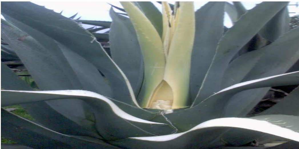
Figura 4. Pica del maguey ( Agave salmiana ).

Los insectos constituyen otro grupo de alimentos asociados al maguey, los “gusanos de maguey” y “chinicuales” son muy apreciados e importantes en la gastronomía hidalguense, el maguey es además el principal hospedero de un grupo de hormigas que en estado juvenil se denominan “escamoles” mismos que son consumidos localmente y se comercializan, alcanzando un alto valor ($ 1,400.00 / kilo aproximadamente).