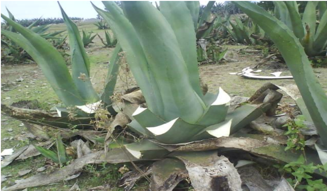
Figura 16. Aprovechamiento de pencas de maguey ( Agave salmiana ) para la preparación de barbacoa.

En el caso del maguey se obtiene el aguamiel para la elaboración del pulque, pencas para la preparación de barbacoa, y productos de consumo estacional como la inflorescencia del maguey llamada (quiote o gualumbo), y en la época de lluvias chinicuiles, chicharas y hongos comestibles (Figura 16).