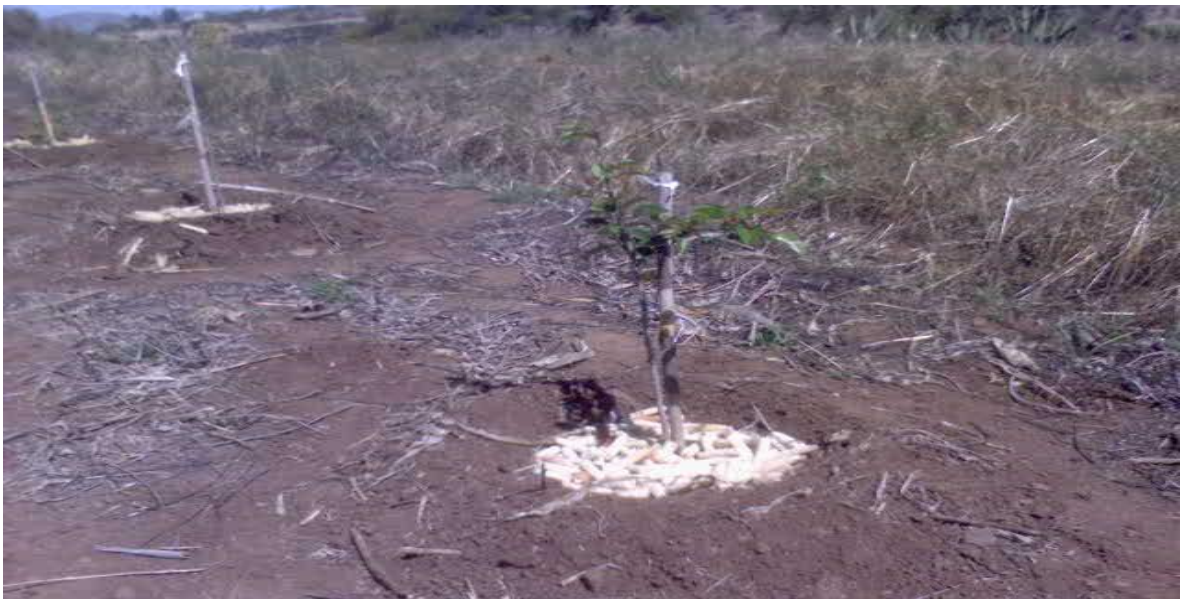
Figura 9. Cajeteo y acolchado en la tecnología de árboles intercalados en cultivos permanentes en la comunidad de La Puebla, Municipio de Atotonilco el Grande, Hgo.

suelo junto a las plantas, de esta manera el agua se aprovechara de manera más eficiente (Figura 9 y 10).