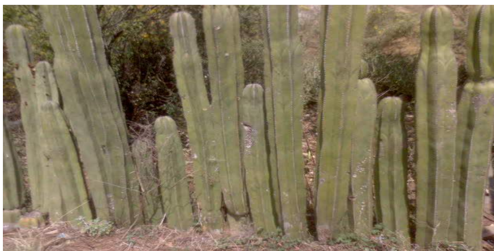
Figura 3. Cerco vivo de órgano ( Pachocereus marginatus ) en la comunidad Tesahuapa, Municipio de Atotonilco el Grande, Hgo.