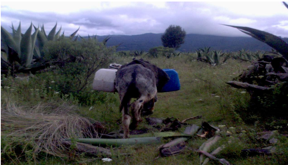
Figura 6. Traslado del Aguamiel.

Cuando se termina el periodo de raspa del maguey las pencas sirven como forraje para el ganado ovino y bovino en la temporada de seca principalmente (Figura 7). Cuando se seca el centro, llamado “mesote”, y las pencas, se utiliza como combustible, el maguey también es medicinal y de sus fibras se hacen zacates para el aseo personal.