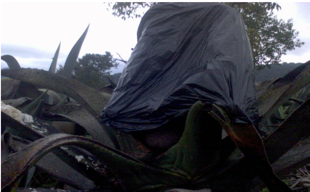
Figura 5. Maguey en producción de aguamiel.