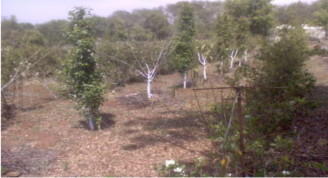
Figura 8. Huerto de manzana ( Malus domestica ), pera ( Pyrus cummunis ) y durazno ( Prunus persica ) intercalado con zarzamora ( Rubus spp. ) en la comunidad de Tesahuapa, Municipio de Atotonilco el Grande, Hgo.