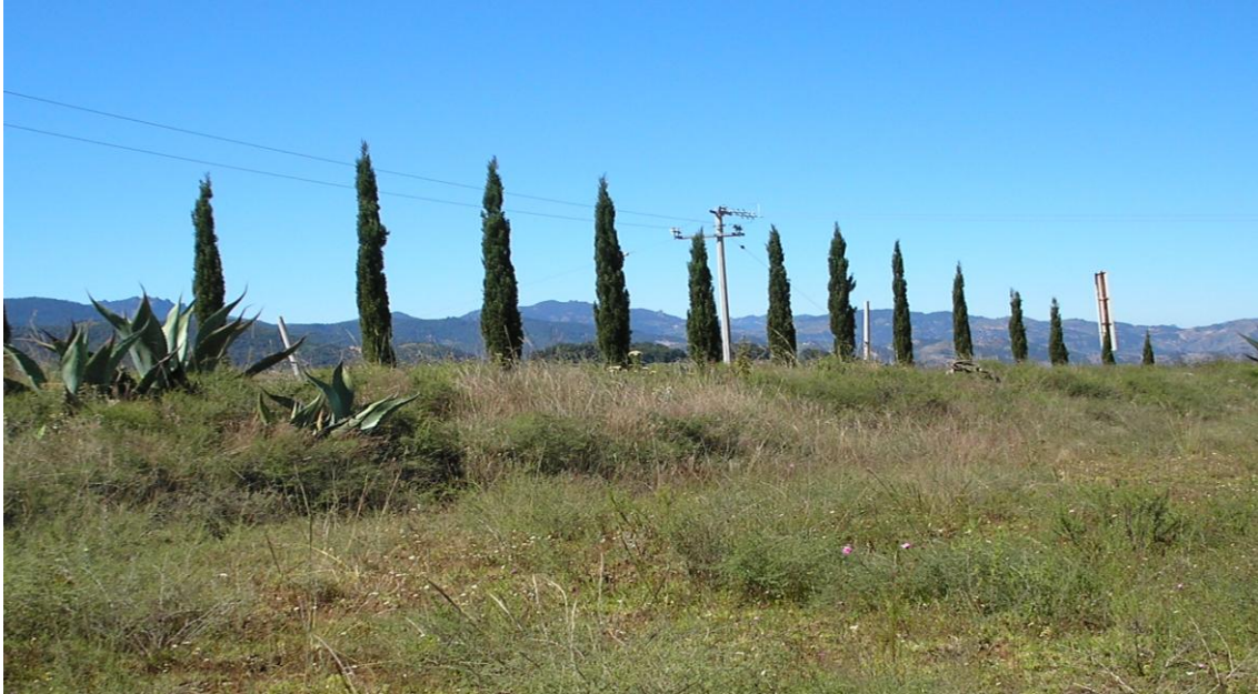
Figura 19. Árboles de cipres ( Cupressus sempervirens ) en lindero en la comunidad de Cantarranas, Municipio de Atotonilco el Grande, Hgo.