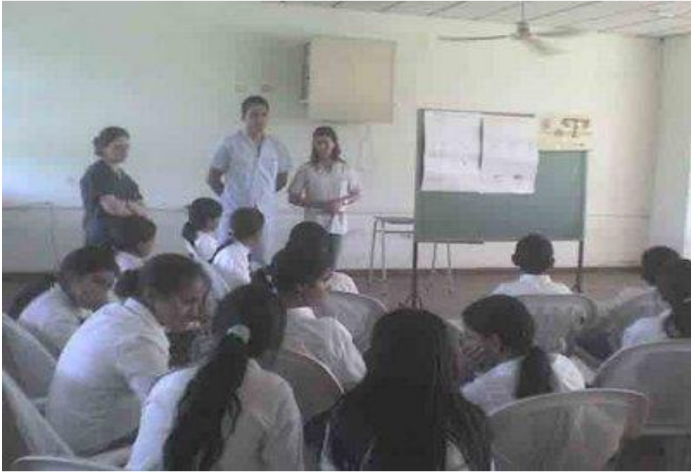
CONFERENCIAS SOBRE TEMAS DE INTERES PARA LOS JÓVENES EN LA ESCUELA SECUNDARIA GENERAL "ARNULFO PACHECO CRUZ" EL CID, TIZAYUCA, HGO.