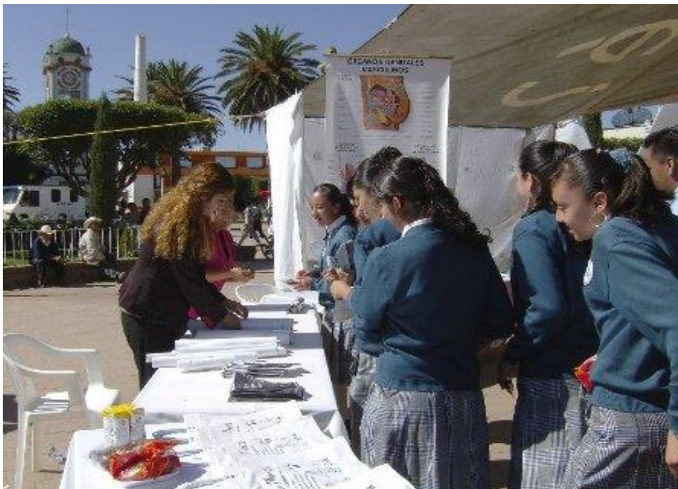
DIFUSIÓN Y PROMOCIÓN DE TEMAS RELACIONADOS CON SEXUALIDAD Y PROBLEMAS SOCIALES (TABAQUISMO, ALCOHOLISMO, ETC.)