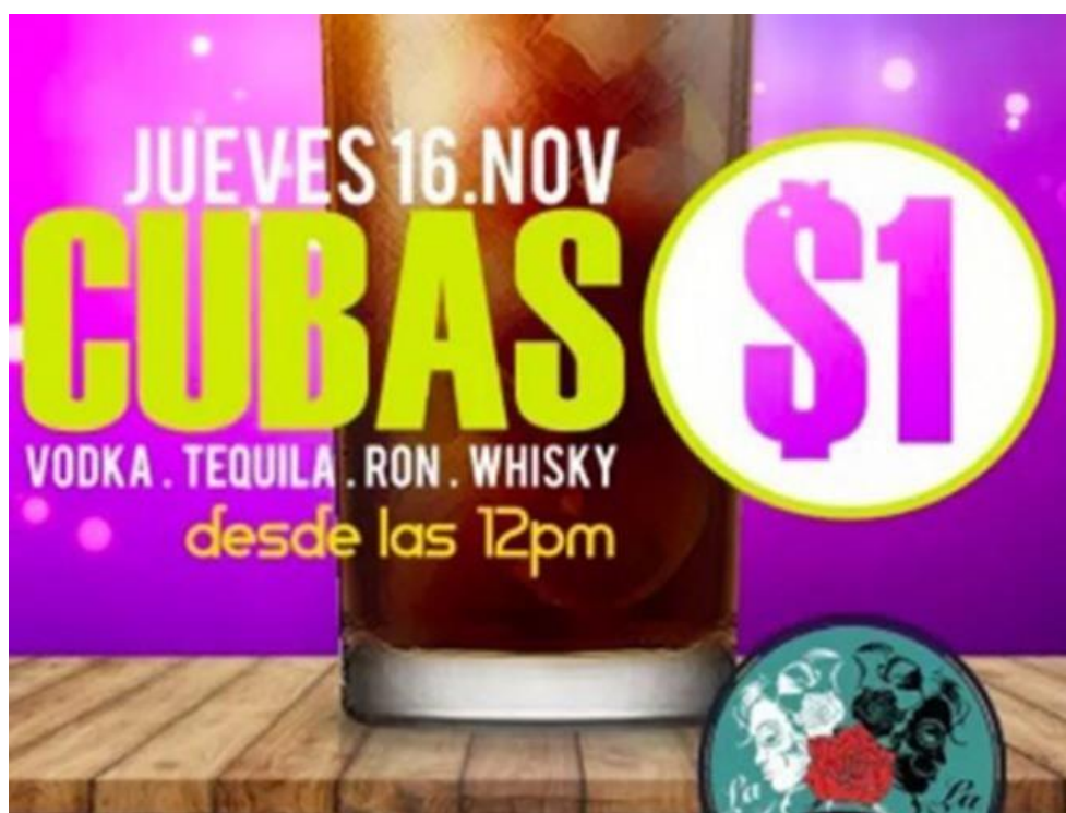
Ilustración 1. Cubas a un peso. Extraído de (Rincón, 2017).

conducta alcohólica de sus consumidores y la pertinencia de los establecimientos. Por mencionar algunos casos, en el año 2017, bares de la zona metropolitana de la ciudad de Pachuca como La Doña Téllez , Velvet y La Palapa iniciaron una estrategia de mercado que consistía en vender “cubas” a un costo simbólico de un peso, y que incluso, un bar conocido como W 2.0 ofrecía pagar un peso por cada trago que un cliente fuera capaz de consumir; toda esta estrategia aplicada en un horario que partía desde las 12:00 pm. Esto claramente desobedecía las normas establecidas por los criterios antes mencionados, incluso hasta el de horario de apertura, el cual estipula la apertura de estos establecimientos a partir de las 02:00 pm (Rincón, 2017).