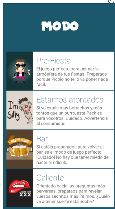
Ilustración 13. "Tomanji". Ejemplo de un juego digital. Captura de elaboración propia. Octubre de 2021