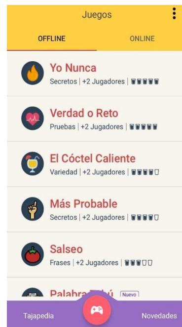
Ilustración 11 "Game of Shots". Ejemplo de un juego digital. Octubre de 2021

Otra propiedad que se aprecia en estos juegos es que las reglas que los organiza son flexibles y se pueden adaptar a los recursos disponibles o las condiciones que sus participantes expongan. Por ejemplo, en distintas ocasiones se participó en un mismo juego