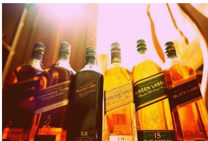
Ilustración 3. Colección "Label" de Johnnie Walker. Extraída de (Reydecop, 2021)

Derivado de lo anterior, otra forma de perseguir mayores índices de venta ha sido a través de la “ premiumización ” de los productos alcohólicos. Esta estrategia consiste en crear colecciones especiales de algún producto y dirigirlas a un sector más adinerado de la población pero que al mismo tiempo no sea totalmente exclusivo de los sectores sociales con una capacidad de adquisición mayor. Esta estrategia se ha llevado a cabo dentro de la industria de las bebidas alcohólicas mediante la puesta a la venta de una colección de productos promocionado con un cierto grado de superioridad frente a la competencia, por lo que dicha colección está disponible en un rango distinto de precios (Robaina, Babor, Pinsky,