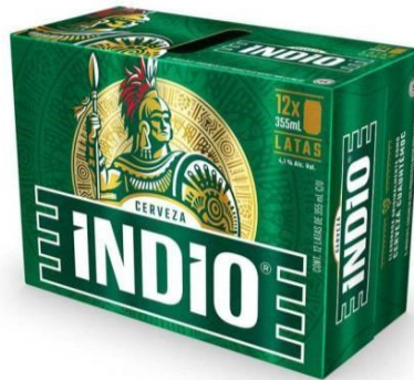
Ilustración 4. Indio 12 Pack.

Llama la atención que las estrategias para aumentar el consumo no se detengan sólo en la elaboración de un producto llamativo y accesible, sino que también se pretende crear una cultura de consumo cada vez más presente en la vida cotidiana de los consumidores. En especial, dos aspectos centrales, un aspecto denominado “la cultura de compartir” y otro que busca resignificar el consumo de bebidas alcohólicas como una actividad común en potenciales situaciones. Sobre la “cultura de compartir” mediante un empaquetado de 12 productos, en lugar de 6, para muchas marcas de cerveza, así como incremento de líquido por en base para los destilados, muchos de los cuáles actualmente ofrecen 750 ml. Toda esta táctica de venta “a granel” está acompañada de un slogan de una excelente relación de calidad-precio para un consumo colectivo dirigido a ese 80% por ciento de la población que se encuentra en los niveles más bajos de ingresos y que, incluso, consumir cerveza es costoso (Robaina, Babor, Pinsky, & Johns, 2020).