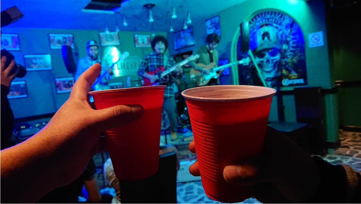
Ilustración 10. "Salud" entre recién conocidos. Julio de 2022

Luego, invocar este tipo de gestos involucra también una suerte de reglas en su proceder que, dependiendo de ser o no ser cumplidas adecuadamente y del tipo de relaciones que las personas involucradas mantengan, puede contraer consecuencias específicas para la creación de vínculos emocionales: