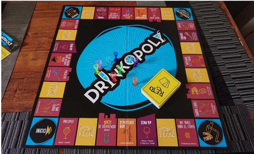
Ilustración 12. "Drinkopoly", ejemplo de un juego físico complejo. Septiembre de 2021