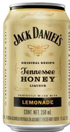
Ilustración 2. Jack Daniel's Tennessee Honey.

La primera de estas es sobre la promoción del alcohol dirigida a grupos determinados . En este sentido, de acuerdo con los estudios recopilados por la fuente en cuestión, se determinó que en América Latina se comienza a beber a una edad más temprana que en Occidente por lo que, poniendo de ejemplo a México, donde hay 63 millones de bebedores potenciales, más el millón que anualmente aumenta cuando estos llegan a la mayoría de edad y, resaltando además que, a medida que las mujeres van ingresando cada vez en mayor cantidad a una actividad laboral formal, sin duda forman un considerable cumulo de consumidores potenciales. Las estrategias fueron, entonces, dedicadas a