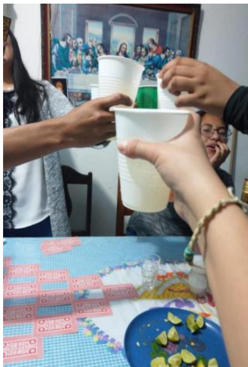
Ilustración 9. ¡Salud entre amigas! Marzo de 2021.

utilería más que la bebida que se esté consumiendo pues, a cambio, se manifiesta una poderosa carga emocional y una serie de connotaciones simbólicas que, a su forma, también demuestra aspectos acordes a la posición que juega cada participante de acuerdo con el tipo de personalidad y otros elementos que componen su individualidad y su papel dentro del grupo.