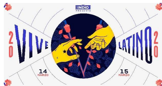
Ilustración 5. Vive Latino.