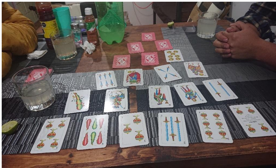
Ilustración 14. “Pirámide” con baraja española. Diciembre de 2021

conocido como “pirámide” 48 ; en la primera ocasión, quien sabía el juego mencionó que este se acostumbra a jugar con una baraja española; sin embargo, en la ocasión posterior, no había una a la mano, pero lo que sí, fue un “Uno”, por lo que, tras analizar la situación, se modificaron algunas reglas antes de comenzar y otras durante el juego y se pudo llevar a cabo la dinámica deseada 49 .