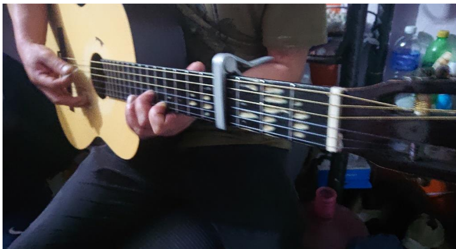
Ilustración 17. "El que canta en las fiestas". Febrero de 2022.

Para ejemplificar lo recién expresado, la fotografía anterior muestra un momento clave dentro de la situación de consumo. En este caso, la persona que toca la guitarra se gana la vida cantando a diario en bares y restaurantes de la ciudad de Pachuca (por cómo puede notarse en el desgaste de los trastes), y siendo este un trabajo comúnmente infravalorado, es difícil encontrarle con mucho tiempo libre. Sin embargo, dio la casualidad de que, mientras que nos dirigíamos hacia una reunión, quien escribe y el dueño de la casa, lo encontramos terminando su jornada, por lo cual, mi acompañante no dudó en invitarlo también. Unos 40 minutos después de haberlo encontrado, él y su esposa se presentaron en el lugar de encuentro con dos jugos de mango, una botella de vodka y una cajetilla de cigarrillos. Y mientras la noche avanzaba, se notó como su personalidad era placentera y amigable, logrando con historias sobre las cosas que le han pasado en los eventos a los que lo contratan entretener a los demás miembros del grupo (que en ese momento éramos 7) y con canciones populares de distintos géneros (que se animó a cantar después de un rato bebiendo) incentivar un consumo más abundante.