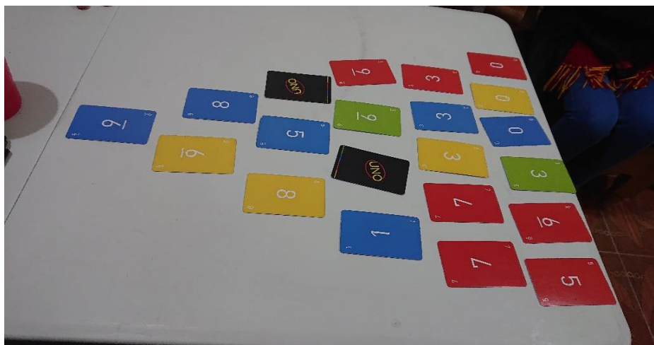
Ilustración 15. "Pirámide con Uno". Diciembre de 2021

También sucede que pueden elaborarse juegos complejos con objetos simples si se cuenta con la cantidad de elementos necesarios y se posee un conocimiento de cómo utilizarlos adecuadamente. El caso más citado es el del "Beer pong" 50 , que, al requerir de unos cuantos vasos desechables, una mesa larga, una pelota y, por supuesto, la suficiente cantidad de bebidas alcohólicas, puede disfrutarse de un juego que requiere concentración y un poco de exigencia de las habilidades motrices.