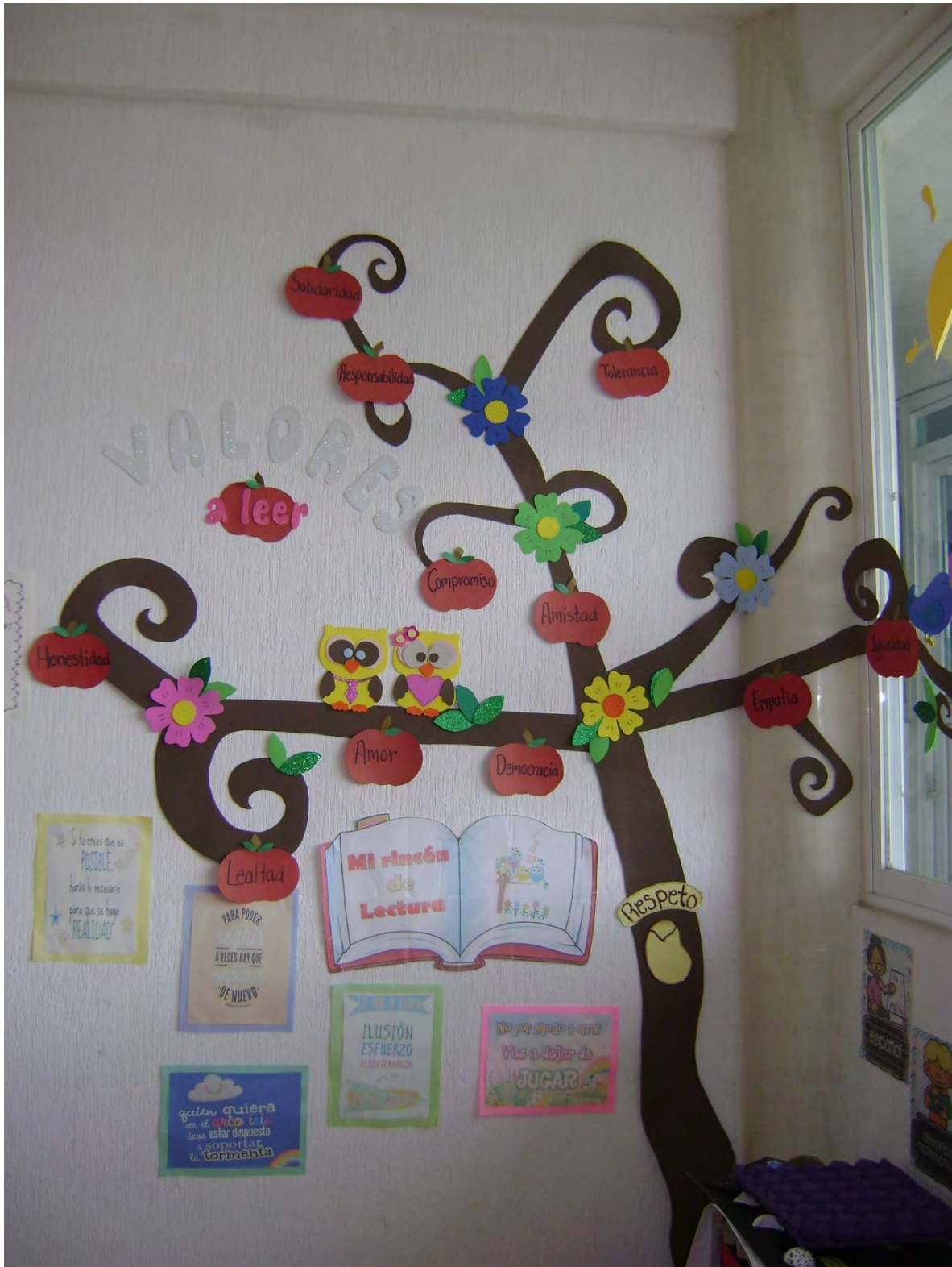
Árbol de valores elaborados por la profesora