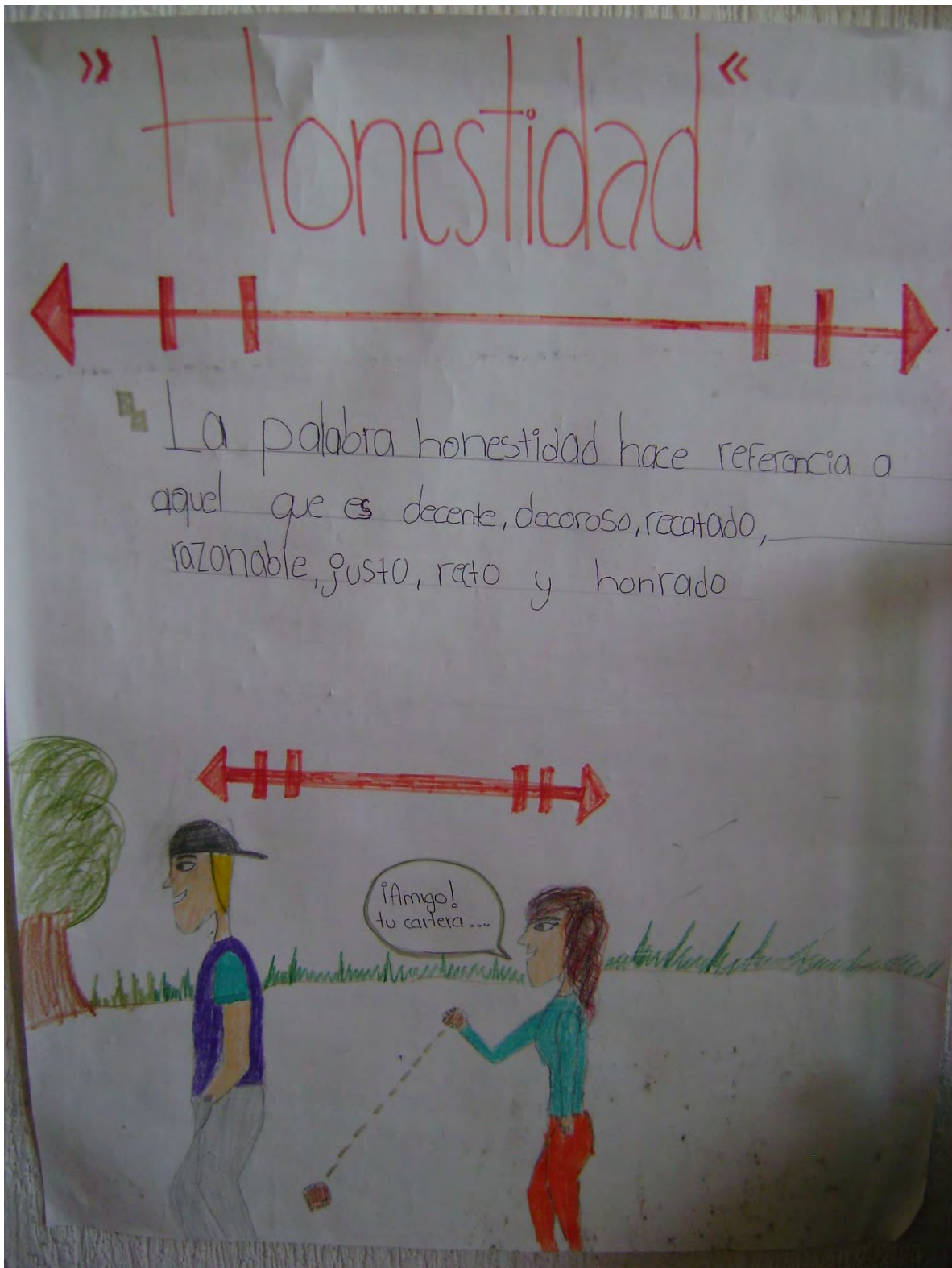
Cartel elaborado por uno de los alumnos donde explica el valor de la honestidad