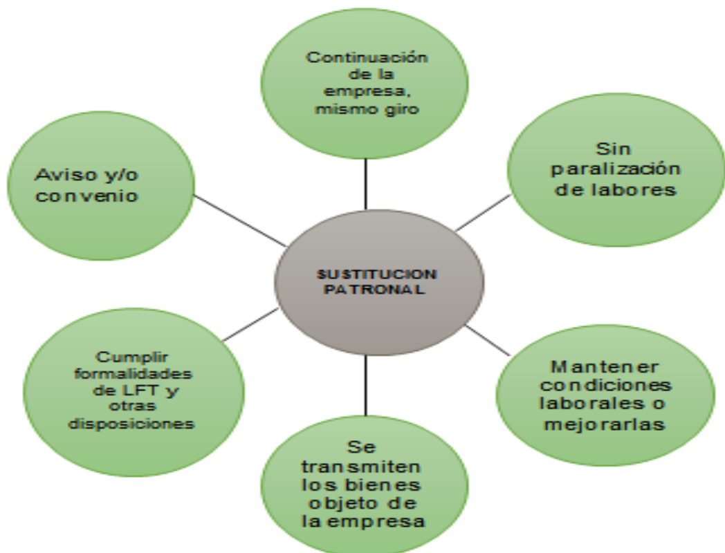
Figura 1. Características en las que se da la sustitución patronal.

Fuente: Elaboración propia con información obtenida en LFT, LSS, Factorial y Conacyt.