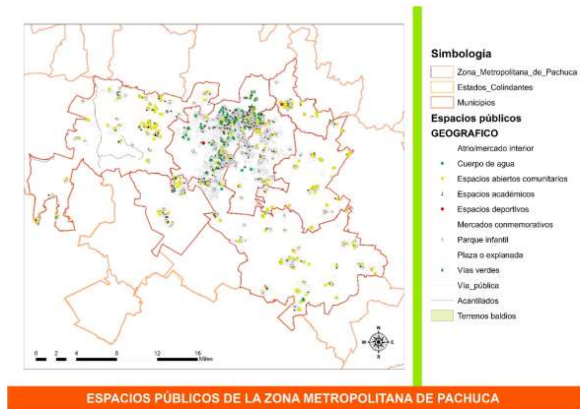
Ilustración 3 Mapa espacios públicos en la Zona Metropolitana de Pachuca. Elaboración propia; México, 2024.

A continuación, se pueden visualizar el mapa de la clasificación de los espacios públicos acorde con la clasificación establecida en el apartado anterior ( Ilustración 3 ).