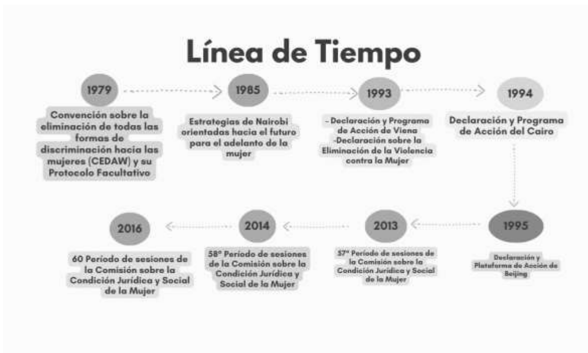
Ilustración 1 Línea del tiempo ciudades seguras. Elaboración propia; México, 2024.

Estas iniciativas proponen la construcción de ciudades seguras para mujeres y niñas, promoviendo los derechos de estas mismas. Sin embargo, cada estrategia debe de estar adaptada al contexto en el que se vive en cada país y para ellos a lo largo de los años se han desarrollado programas de protección contra los derechos de la mujer ( Ilustración 1 ):