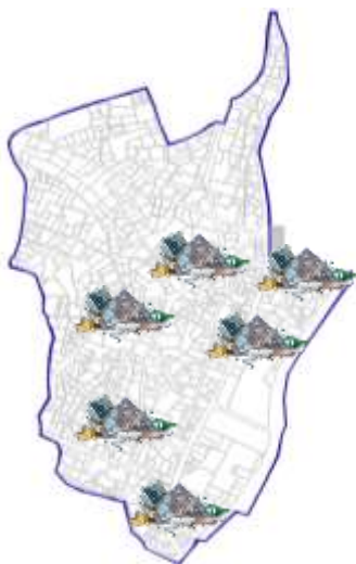
Ilustración 5 Espacios de residuos sólidos de "El barrio el Arbolito" (Retomado del Proyecto de CONAHCYt Hacia la construcción de un barrio sostenible).

“El tema de los residuos sólidos es el que más preocupa a los vecinos del barrio, ya que se cuenta con puntos identificables donde la gente tira basura ( Ilustración 5 ), esto ocasiona una mala imagen urbana, provocando un foco de infección para quien habita ahí. El problema de la basura se origina en la parte alta del barrio, en donde la movilidad vehicular es inexistente, el lugar se comprende en su mayoría por callejones, mismo que se ubican en la parte alta, en donde los habitantes al no tener donde dejar sus desechos optan por depositarlas en las calles principales, originando montones de basura, aunado a esto la fauna domestica rompen las bolsas de desechos originando un problema aún mayor, respecto a este problema las autoridades no han propuesto solución, además de que no existe cultura respecto a la cultura ambiental, reciclaje y/o separación de desechos sólidos”.