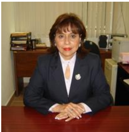
Sara Montes Romero.