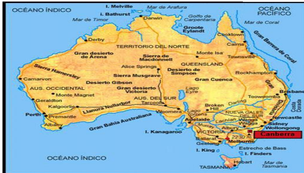
Mapa de Australia 2.1