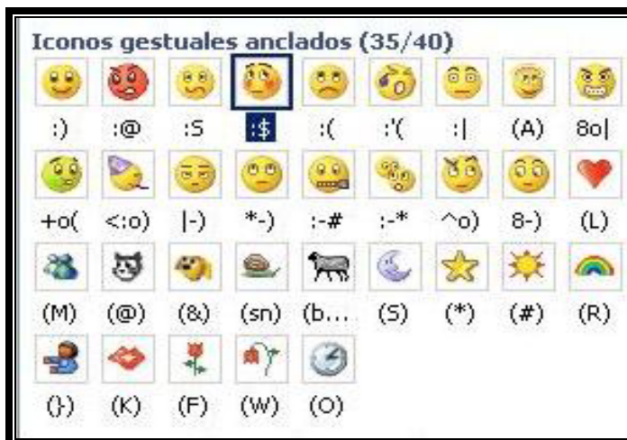
Figura (2) Emoticonos del programa mns Messenger. (2004)