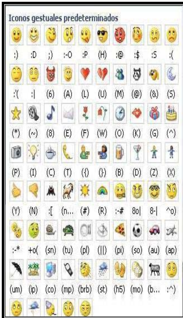
Figura (1) Emoticonos del programa mns Messenger (2004)